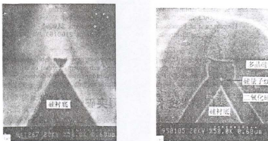
图2 样品横截面 SEM 观察照片

硅量子线的制作是在硅(100)单晶衬底上通过热氧化、反应离子刻蚀和各向异性化学腐蚀, 在衬底上刻蚀出的横截面为倒置三角形硅线, 它们处在衬底锯齿的顶部, 此时尚未与衬底分离。图2给出了刻蚀样品(011)横截面的扫描电镜观察照片。然后采用热氧化处理, 对硅线进行细化, 同时, 形成硅/二氧化硅异质界面, 量子线完全与衬底隔离, 并消除刻蚀过程带来的表面损伤。实验研究发现, 超细微尺寸的硅材料存在着自限制氧化效应, 通过改变氧化温度可以非常有效地控制量子线的最终尺寸。图2(b)是热氧化后样品(011)横截面扫描电镜观察照片, 可以清楚地看到超精细的硅量子线已经形成, 完全包含在热氧化形成的二氧化硅层内。这里量子线尺寸小于20纳米。